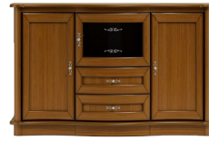
C07 156 x 100 x 50