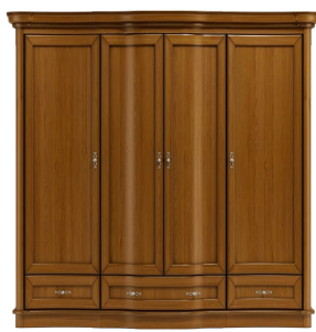
C29 206 x 203 x 60