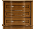
C04 100 x 85 x 50