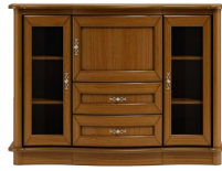
C06 136 x 100 x 50