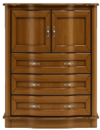
C09 100 x 121 x 50