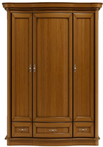
C28 166 x 203 x 60