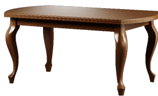
S21 100 x 76 x 100 160 x 76 x 100 200 x 76 x 100