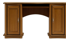
C30 156 x 85 x 68