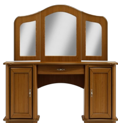
C33 156 x 155 x 50