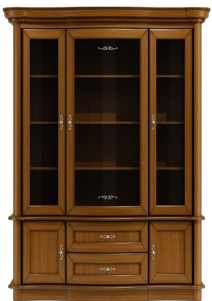
C32 166 x 203 x 50