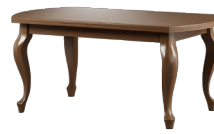
LS21 118 x 60 x 60 130 x 70 x 60