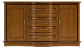
C08 176 x 100 x 50