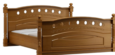
C34 190,210 x 105 x 214 Wymiar materaca: 160,180 x 200