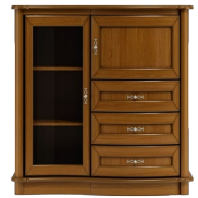
C11 116 x 121 x 50