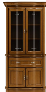
C14 110 x 117 x 50