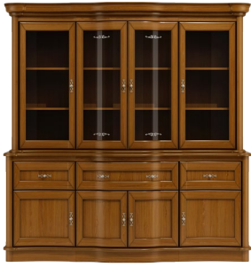
C24 196 x 117 x 50 C25 196 x 85 x 50