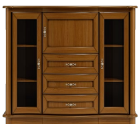
C12 136 x 121 x 50