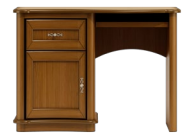
C31 116 x 85 x 68