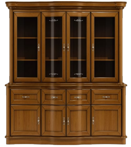
C22 176 x 117 x 50 C23 176 x 85 x 50