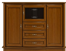
C13 156 x 121 x 50