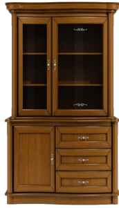
C18 126 x 117 x 50 C19 116 x 85 x 50