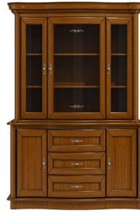
C20 156 x 117 x 50 C21 156 x 85 x 50