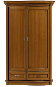
C27 126 x 203 x 60