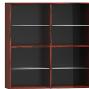
CR03 100 x 100 x 30