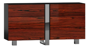
CR08 150 x 82 x 45