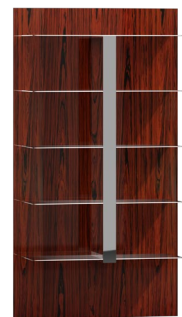
CR12 102 x 188 x 30