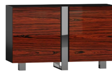
CR07 130 x 82 x 45