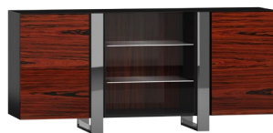
CR10 172 x 82 x 45