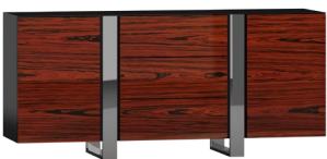
CR09 172 x 82 x 45