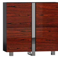
CR11 130 x 130 x 45