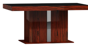
SCR 160 x 76 x 100 200 x 76 x 100